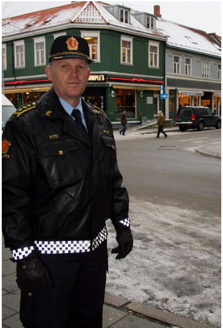
Hver helgenatt tar tre patruljer fra sentrumspolitiet plass i Midtbyen for å forebygge bråk. Én her ved hjørnet ved Carl Johans gate og Nordre gate, én i krysset Nordre – Fjordgata, og den siste konsentrerer seg om strøkene lenger opp i Nordre gate.

– Flere store byer har gode erfaringer med å fokusere på såkalt ansvarlig vertskap. Det bevisstgjør alle ansatte i bransjen på det ansvaret de har.