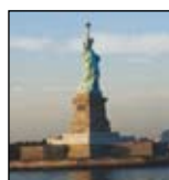
Nært og fjernt

Personlig service, nærhet og engasjement!