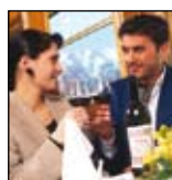
Den ultimate luksusopplevelsen